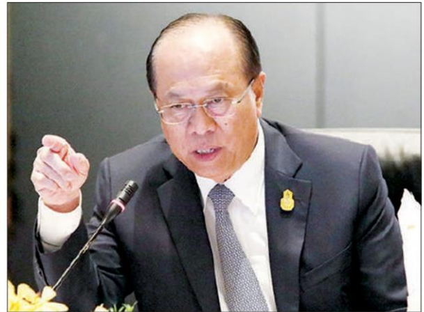
พล.อ.อนุพงษ์ เผ่าจินดา รัฐมนตรีช่วยว่าการกระทรวงมหาดไทย

มาดว่า "คู่มือนี้" มีสาระสำคัญ เต็มๆ อย่างไร? นอกจากมหาดไทยจะเป็นเจ้าภาพ สร้างความเข้าใจกับ "กลุ่มเป้าหมาย" ที่พร้อมเสนอโครงการ ให้เป็นไปตาม พ.ร.ก.การกู้เงินสู้โควิด-19 หลังจากสภาพัฒน์ ได้ปรับหลักเกณฑ์เล็กน้อยมาแล้ว